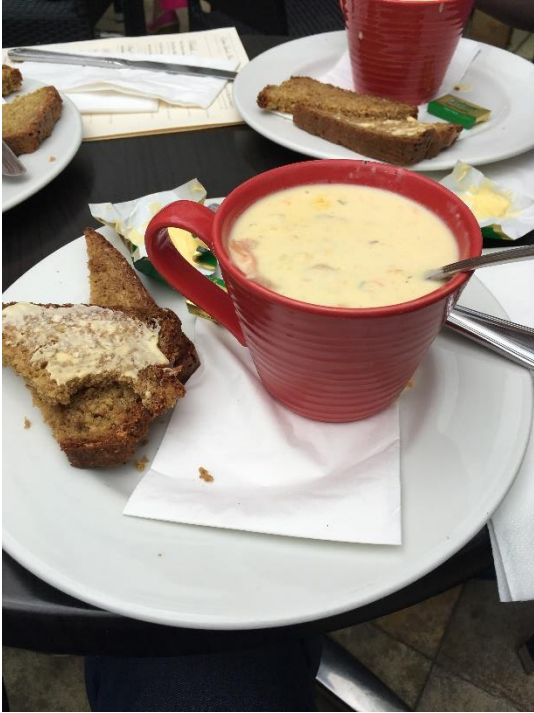
Chowder, a hallevs