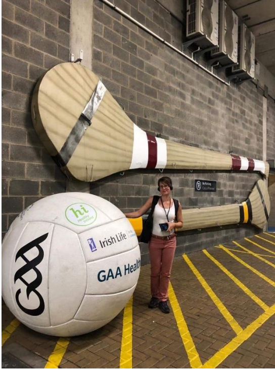
A GAA stadionban